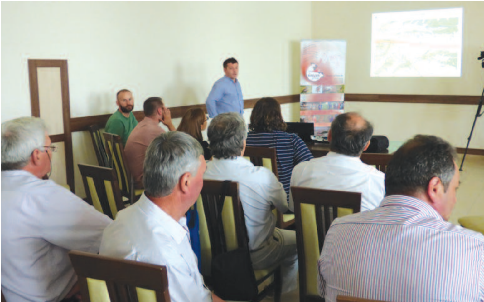
Kiderült: egy keveset hajlandók módosítani a terven, hogy a Nyárádmente is jól járjon