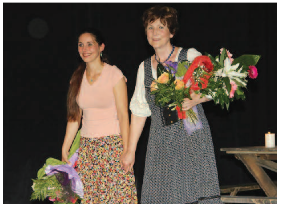
Percekig zúgott a taps

A 4. atyhai kiállítás augusztus 7-ig látogatható. (N.M.K.)